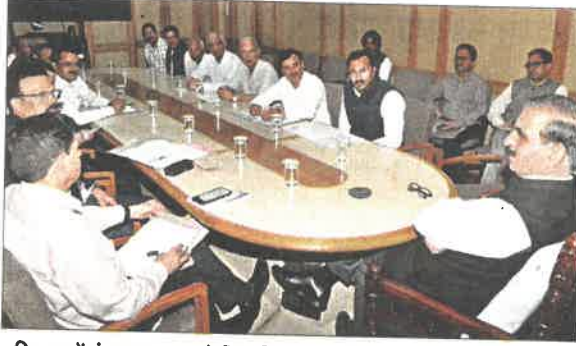
शिमला में मंगलवार शाम को बिजली बोर्ड के अधिकारियों और संयुक्त मोर्चा के पदाधिकारियों के साथ बैठक करते सीएम सुखविंद्र सिंह सुक्खू।

मुख्यमंत्री ने चार्जशीट के आदेश तुरंत वापस लेने के निर्देश भी दिए। कर्मचारियों की जायज मांगों पर सहानुभूतिपूर्वक विचार किया जाएगा। मुख्यमंत्री ने कहा कि राज्य सरकार बोर्ड को सुदृढ़ बनाने और इसे वित्तीय