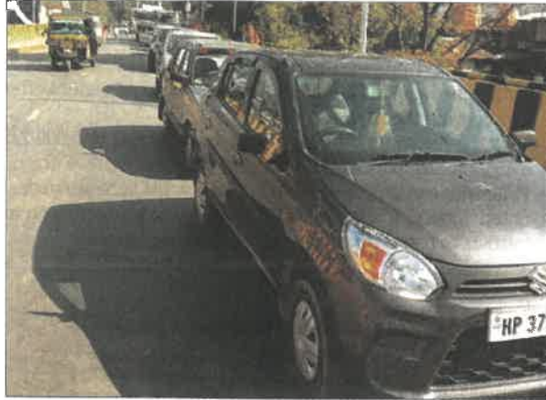
The town will get rid of idle parking soon.

The funds, released under the Asian Development Bank (ADB) tourism projects, are part of ongoing initiatives to promote tourism in Himachal Pradesh. Butail noted that since CM Sukhu has declared Kangra as the tourism capital of the state, strengthening