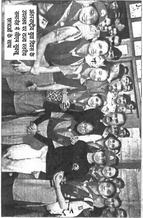
अंतरराष्ट्रीय युवा दिवस के उल्लास पर राज्य स्तरीय समारोह में सीएम सुखबू छात्राओं के साथ

मुख्यमंत्री ने 12 अगस्त से 12 अक्टूबर तक चलने वाले एचआईवी जागरूकता अभियान का शुभारंभ किया। यह अभियान राज्य के 6,000 गांवों और 1,500 से अधिक शैक्षणिक संस्थानों को कवर करेगा। उन्होंने शिमला में 50 टैबसी चालकों को कार-बिन वितरित किए और कार-बिन वितरण के दूसरे चरण का शुभारंभ किया। पहले चरण में 4,000 कार-बिन वितरित किए गए थे, जबकि दूसरे चरण में 6,000 कार-बिन वितरित किए जाएंगे। उन्होंने नशीली दवाओं के दुरुपयोग और एचआईवी के प्रति जागरूकता शपथ भी दिलाई। मुख्यमंत्री ने सुझाव अपने सरकारी अवास से 'रेड रन' और 'साइकिल रन' को झंडी दिखाई और विजिताओं को सम्मानित भी किया।