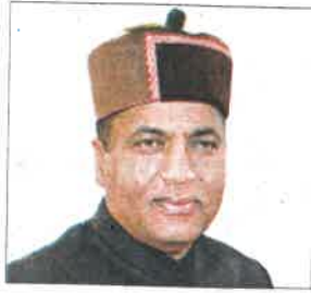
दिव्य हिमाचल ब्यूरो – शिमला

नेता प्रतिपक्ष जयराम ठाकुर ने कहा कि राज्य सरकार की लापरवाही की वजह से हिमाचल प्रदेश में रेलवे की परियोजनाएं प्रभावित हो रही हैं। हिमाचल सरकार हिमाचल के रेल नेटवर्क विस्तारीकरण में अपने हिस्से के काम में सहयोग नहीं कर रही है, जिससे हिमाचल प्रदेश की