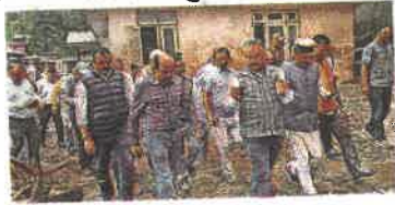
सराज क्षेत्र के दौरे पर शिक्षण संस्थानों का निरीक्षण करते शिक्षा मंत्री।