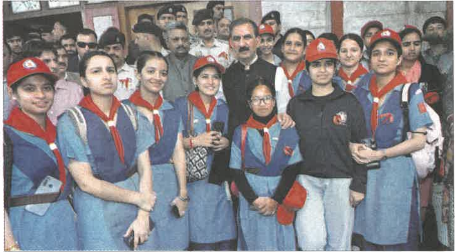
Chief Minister Sukhvinder Sukhu with students on the occasion of International Youth Day in Shimla.

Sukhu said that reforms in the education sector had elevated Himachal Pradesh's ranking from 21st to fifth in