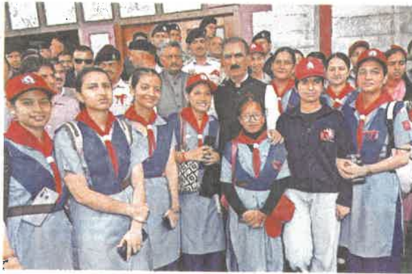
Chief Minister Sukhvinder Singh Sukhu during an event in Shimla on Tuesday.

Educational reforms raised the state's national ranking from 21st to 5th, he said.