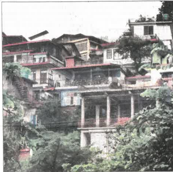
Balmiki Colony in Dharamsala.

The issue was recently taken up with Himachal Pradesh Chief Minister Sukhvinder Singh Sukhu by Devinder Jaggi, former Mayor of Dharamsala, who urged the government to