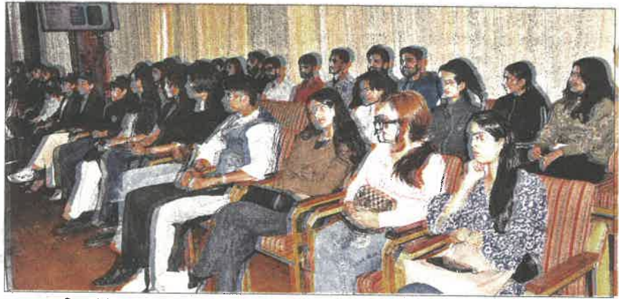
शिमला के बचत भवन में राष्ट्रीय युवा दिवस पर आयोजित कार्यक्रम में भाग लेते युवा।