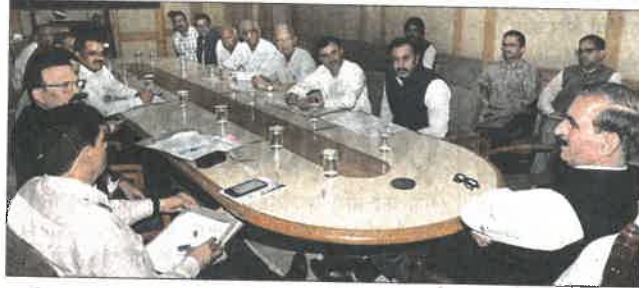
शिमला : विद्युत बोर्ड लिमिटेड की संयुक्त कार्य समिति के प्रतिनिधिमंडल के साथ बैठक की अध्यक्षता करते मुख्यमंत्री सुखविंदर सिंह सुक्खू।

इस मौके पर मुख्यमंत्री ने प्रबंधन को तुरंत चार्जशीट को वापस लेने के आदेश जारी किए। उन्होंने बोर्ड प्रबंधन द्वारा बोर्ड कार्यस्थलों पर बैठक और धरना-प्रदर्शन पर लगी रोक से असहमति जताई और कहा यह संगठनों के