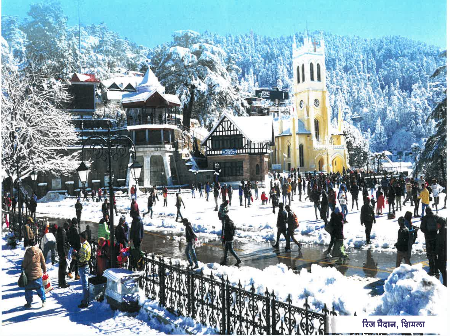
रिज मैदान, शिमला