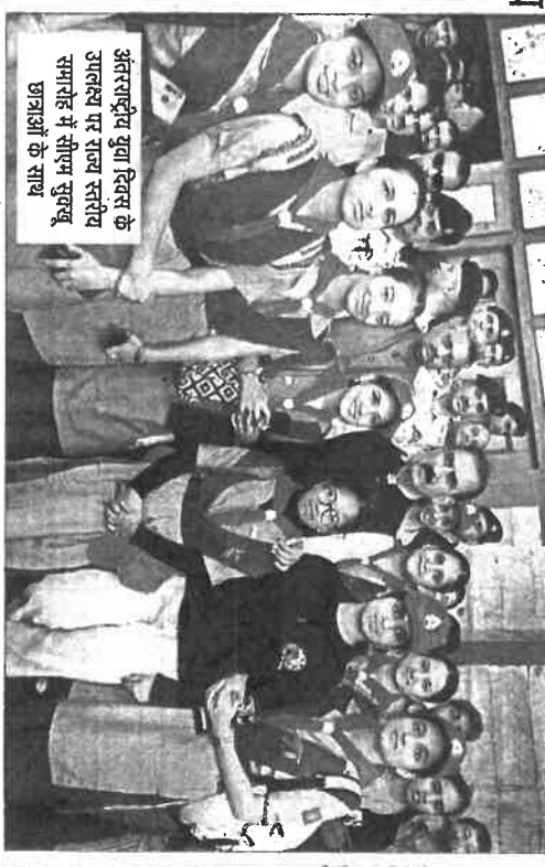
अंतरराष्ट्रीय युवा दिवस के उल्लास पर राज्य स्तरीय समारोह में सीएम सुक्खू छात्रों के साथ

मुख्यमंत्री ने 12 अगस्त से 12 अक्तूबर तक चलने वाले एचआईवी जागरूकता अभियान का शुभारंभ किया। यह अभियान राज्य के 6,000 गांवों और 1,500 से अधिक शैक्षणिक संस्थानों को कवर करेगा। उन्होंने शिमला में 50 टैबल चालकों को कार-बिन वितरित किए और कार-बिन वितरण के दूसरे चरण का शुभारंभ किया। पहले चरण में 4,000 कार-बिन वितरित किए गए थे, जबकि दूसरे चरण में 6,000 कार-बिन वितरित किए जाएंगे। उन्होंने नशीली दवाओं के दुरुपयोग और एचआईवी के प्रति जागरूकता शपथ भी दिलाई। मुख्यमंत्री ने युवाएं अपने सरकारी अवास से 'रेड रन' और 'साइकिल रन' को बढ़ी दिखाई और विजलाओं को सम्मानित भी किया।