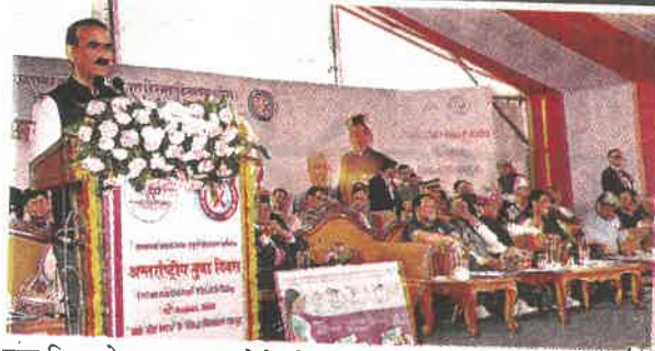
युवा दिवस के अवसर पर लोगों को संबोधित करते हुए मुख्यमंत्री सुखखू।

राज्य सरकार प्रदेश में पर्यटन को बढ़ावा देने के लिए आने वाले समय में 3000 करोड़ रुपए का निवेश करेगी। साथ ही सरकार प्रदेश में बेरोजगार युवाओं को रोजगार के अवसर प्रदान करने के लिए होम स्टे निर्माण पर 4 प्रतिशत ब्याज पर ऋण की सुविधा भी प्रदान करेगी। यह बात मुख्यमंत्री सुखविंदर सिंह सुखखू ने आज शिमला में मनाए गए अंतरराष्ट्रीय युवा दिवस के अवसर पर आयोजित राज्य स्तरीय समारोह की अध्यक्षता करते हुए कही। मुख्यमंत्री सुखविंदर सिंह सुखखू ने प्रदेश के युवाओं से नशे से दूर रहने और प्रदेश को नशा मुक्त राज्य बनाने के प्रयासों में सक्रिय रूप से सहयोग करने का आग्रह किया। उन्होंने युवाओं से नशा तस्करो की सूचना पुलिस को देने की अपील की और कहा कि राज्य सरकार नशे की गिरफ्त में फंसे लोगों के पुनर्वास के लिए प्रतिबद्ध है। उन्होंने कहा कि नशा माफिया के खिलाफ सख्त कार्रवाई की जा रही है, जिसमें उनकी संपत्ति जब्त करना भी शामिल है।