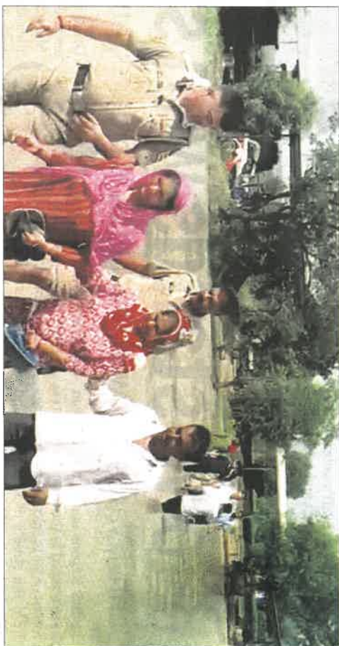
Kangra Deputy Commissioner Hemraj Bairwa inspects the mand areas of Fatehpur and Indora subdivisions; and (right) flood-hit families being rescued in Mand Bhogarwan.

locations within the panchayat with the intervention of the Indora SDM and assistance from the local police.