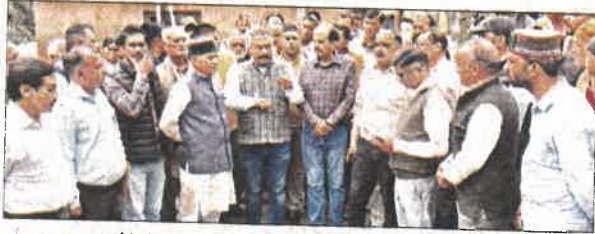
युनाग। सराज दौरे के दौरान लोगों से बातचीत करते शिक्षा मंत्री