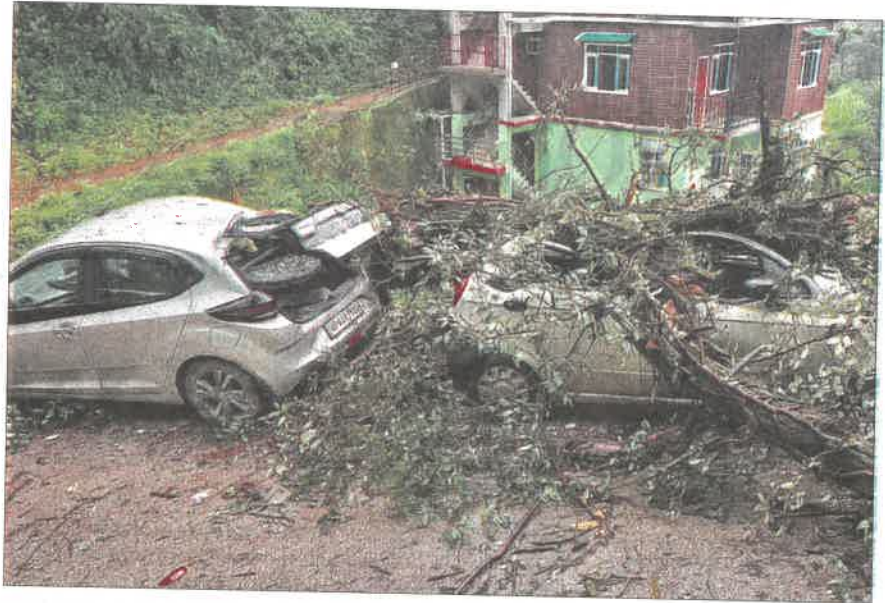
Vehicles crushed under uprooted trees following heavy rainfall in Shimla on Tuesday.

In state capital Shimla, three to four vehicles were