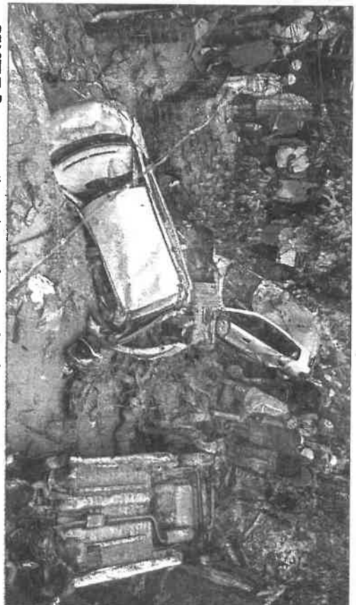
REACTIVE: Rescue operation underway after recent flash floods in Mandi, Himachal Pradesh. PH

The answer lies in a toxic blend of short-sighted political decisions, unscientific development planning and the failure of administrative accountability. The Himalayan region in HP and Uttarakhand has been marketed as a space for tourism, hydroelectric expansion and road connectivity under the guise of "development". Political leadership