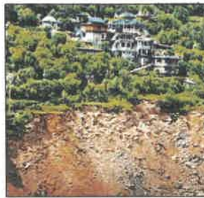
Villagers say land has started sliding since NHAI began widening Kiratpur-Manali highway

Houses in Tanipari, Shala Nal, Jala Nal, Tanhul, and Thalout villages in Balichowki sub-division have developed cracks, while agricultural land has been sliding ever since the widening work started around four years ago, according to residents. All five villages are located right above the highway.