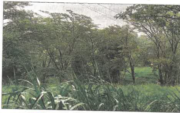
GREEN DEMOLITION The land designated for a tourism village, which is home to hundreds of green trees, is likely to be cleared, potentially resulting in the felling of these trees.

However, the project is mired in legal hurdles. The Himachal Pradesh High Court has stayed