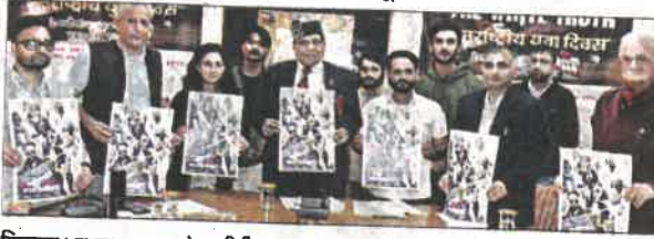
शिमला। द व्हाइट ट्यूथ वेब सीरीज का ट्रेलर लांच करते स्वास्थ्य मंत्री