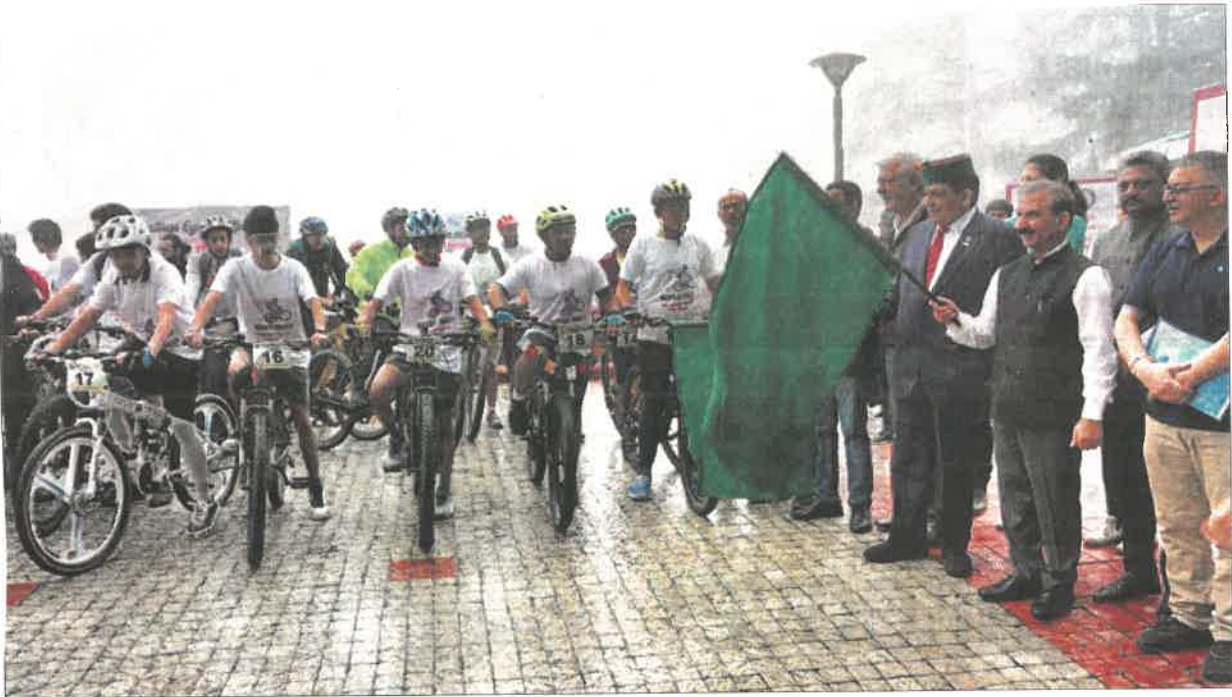
Chief Minister Sukhvinder Singh Sukhu and Health Minister Dhani Ram Shandil flag off the event in Shimla on Tuesday.