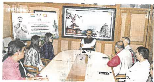
शिमला में मंगलवार को भूटान के प्रतिनिधिमंडल से भेंट करते सीएम •