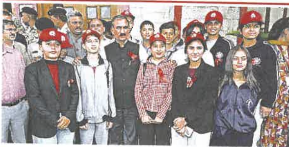
शिमला में मंगलवार को अंतरराष्ट्रीय युवा दिवस पर युवाओं के साथ मुख्यमंत्री सुखविंदर सिंह सुक्खू। इस अवसर मंत्री व विधायक भी मौजूद रहे

• अगले शैक्षणिक सत्र से प्रदेश में 10 राजीव गांधी राजकीय डे बोर्डिंग स्कूल होंगे आरंभ