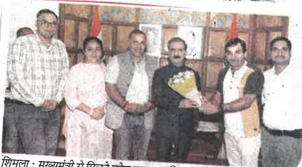
शिमला : मुख्यमंत्री से मिलते प्रदेश कम्प्यूटर शिक्षक संघ के पदाधिकारी।

मुख्यमंत्री ने बताया कि इन बीजों में औषधीय गुणों के साथ-साथ एंटीऑक्सीडेंट तत्व भी प्रचुर मात्रा में पाए जाते हैं। उन्होंने भूटान सरकार को चिलगोजा के पौधे लगाने के लिए तकनीकी सहायता प्रदान करने की पेशकश की। ताशी पेलडन ने चिलगोजा के पौधे प्रदान करने के लिए मुख्यमंत्री का आभार व्यक्त किया। उन्होंने कहा कि यह पहल मैत्री संबंधों को और मजबूत बनाने में सहायक होगी।