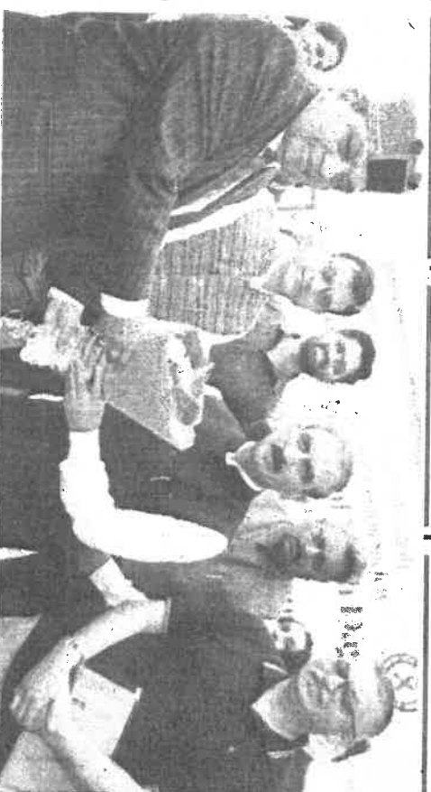
मुख्यमंत्री सुखविंदर सिंह सुक्खू ने एचआईवी जागरूकता अभियान का शुभारंभ किया।

12 अक्टूबर तक अगले तीन गांव चलेगा प्रयाग-प्रयाग