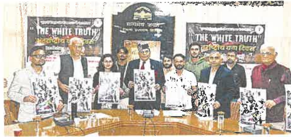
वेब सीरीज का ट्रेलर लांच करते डा. धनीराम शांडिल व समिति के पदाधिकारी

इस दिशा में प्रदेश सरकार जल्द कदम उठाएगी। यह बात स्वास्थ्य मंत्री डा. धनीराम शांडिल ने मंगलवार को अंतरराष्ट्रीय युवा दिवस पर शिमला स्थित बचत भवन में हिमाचल ज्ञान विज्ञान समिति के युवा बचाओ अभियान के तहत नशे के खिलाफ द व्हाइट ट्रूथ वेब सीरीज का ट्रेलर लांच करने के दौरान कही। सात एपिसोड की वेब सीरीज नशे की गिरफ्त में फंसे लोगों के ऊपर आधारित है। नशे के खिलाफ लोग क्या भूमिका निभा सकते हैं, इसका संदेश वेब सीरीज से दिया जाएगा। टीएफटी प्रोडक्शन की बनाई सीरीज समिति के यूट्यूब चैनल पर है।