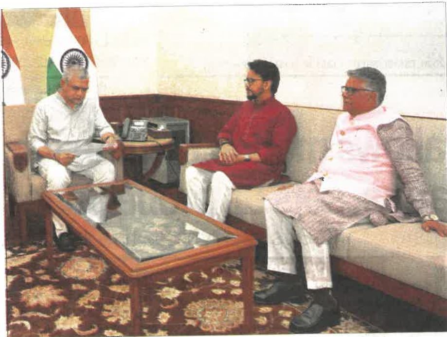
Hamirpur MP Anurag Thakur and Kangra MP Rajiv Bhardwaj meet with Union Railway Minister Ashwini Vaishnaw in New Delhi on Tuesday.