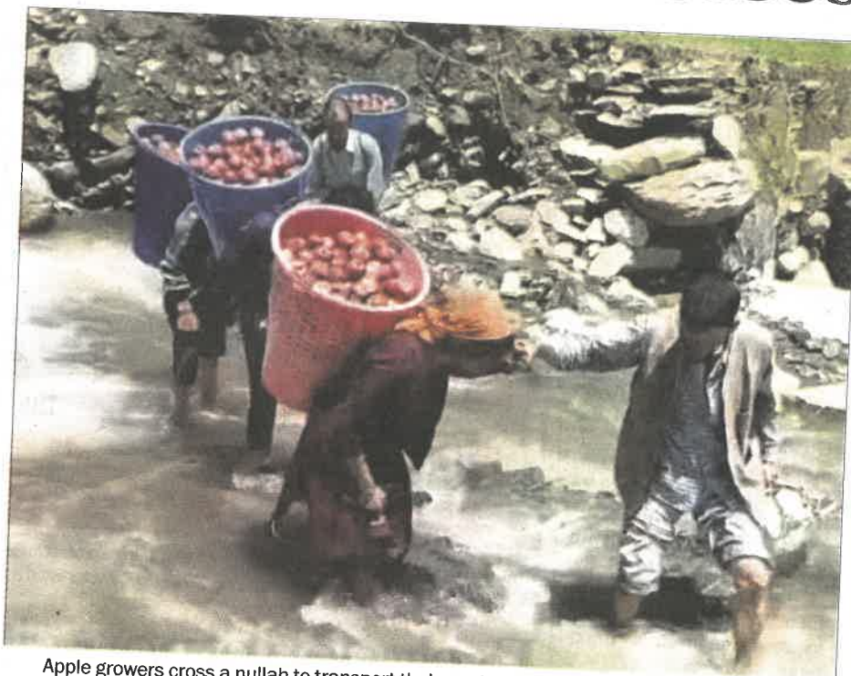
Apple growers cross a nullah to transport their produce to the market as roads in Mandi damaged by a cloudburst are yet to be restored.